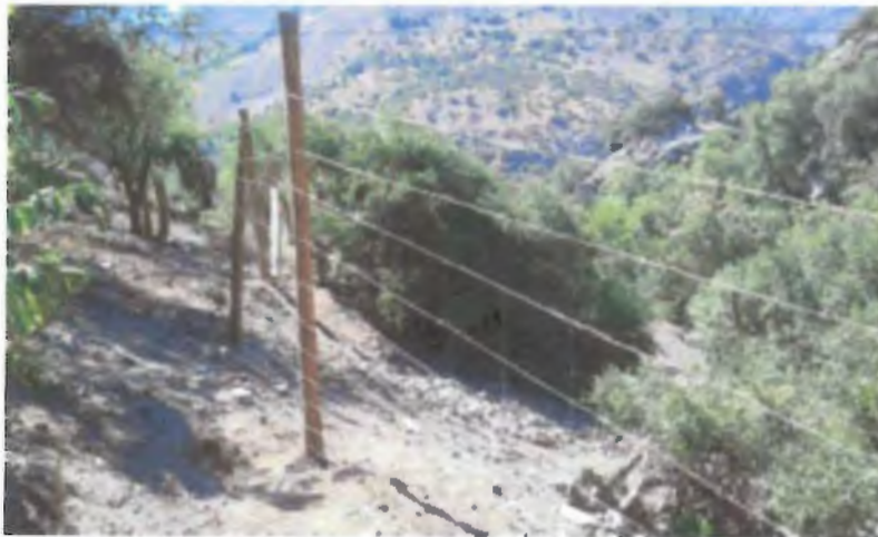
Figura N°1. Mantención de Sector Trasplante de Guayacán