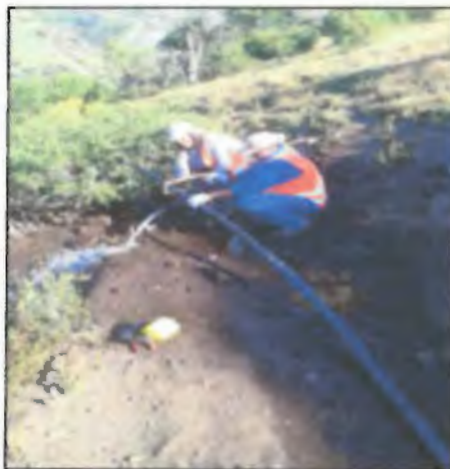
Figura N°3 Reparación de matriz Sector El Durazno

Cada 15 días se deberá revisar las mangueras, además de los goteros y la matriz de riego, de manera de que no se vea afectado el buen desarrollo de las plantas. Por último se realizarán los despiches correspondientes.