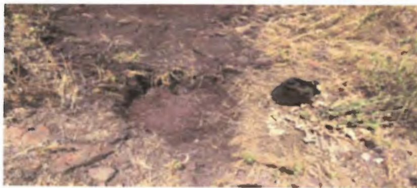
Figura N°6. Replante Sector Estaque Multipropósito

Para la situación de plantas agrupadas, se aplican 10 gramos de hidrogel y 30-35 gramos de Basacote 6M. El Basacote se deposita a ambos lados de la planta en partes iguales, a una profundidad de 10-15cm del suelo, y alejado de la planta. Posteriormente se procede a colocar la protección reforzada con alambre y corchetes, además del coligues y se entrega un riego de establecimiento.