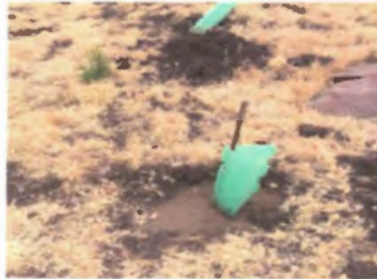
Figura N°5. Riego Sector Multipropósito