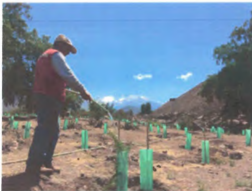
Figura N°4.Riego Sector Estanque Maiteas