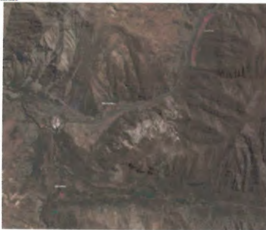
Imagen 2: Imagen google de sectores a mantener en el Área de Los Piches, Salto de agua y Queltehues