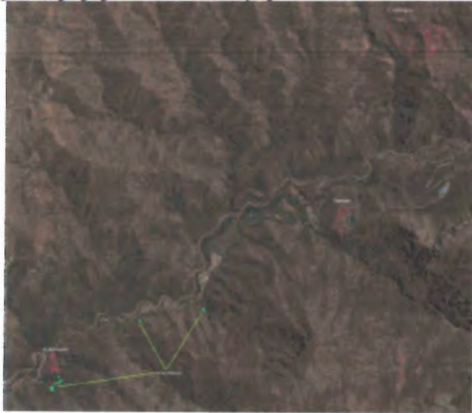
Imagen 1: Imagen google de sectores a mantener y vigilar en el Área del Colorado

Especificaciones Técnicas Mantenciones Forestales 2017 REVI